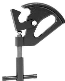
HTTMC00002 Reifenmontage-Zwinge für

Wird für 15° AG-Profilfelgen in Doppelklemmenmontage als Hilfsklemme mit kleinerem HTTMC00002 verwendet.