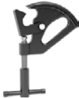
HTTMC00002 Reifenmontage-Zwinge für

Wird für 15° AG-Profilfelgen in Doppelklemmenmontage als Hilfsklemme mit kleinerem HTTMC00002 verwendet.